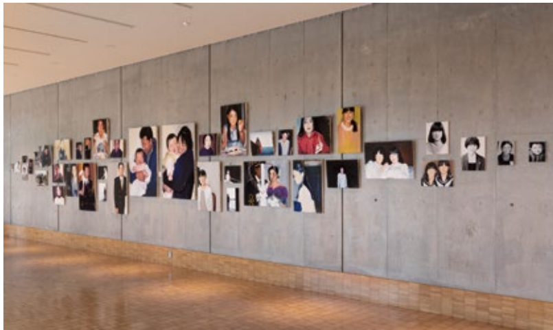
菊池安純 「奇跡の軌跡」 油彩、キャンバス／サイズ可変