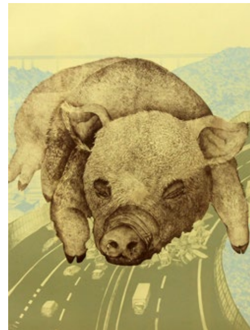
加納卑弥呼 「癡」 リトグラフ/ H600×W450mm