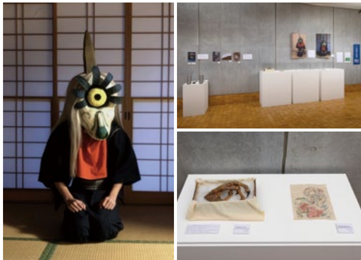
井上晴日 「カサシロ様信仰にまつわる調査と資料館の再現展示」 ミクストメディア/サイズ可変