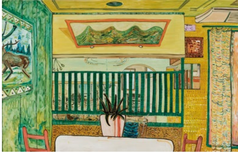
佐藤遥加 「厨房が見えそうな席」 油彩、キャンバス／H1460×W2270mm