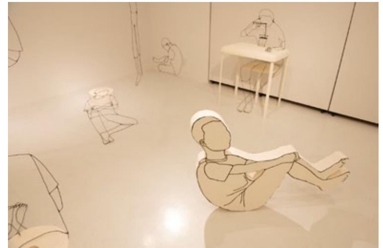
久保田華布 「記憶の存在・存在の記憶」 カラーワイヤー、グーガン、スタイロフォーム、布／サイズ可変