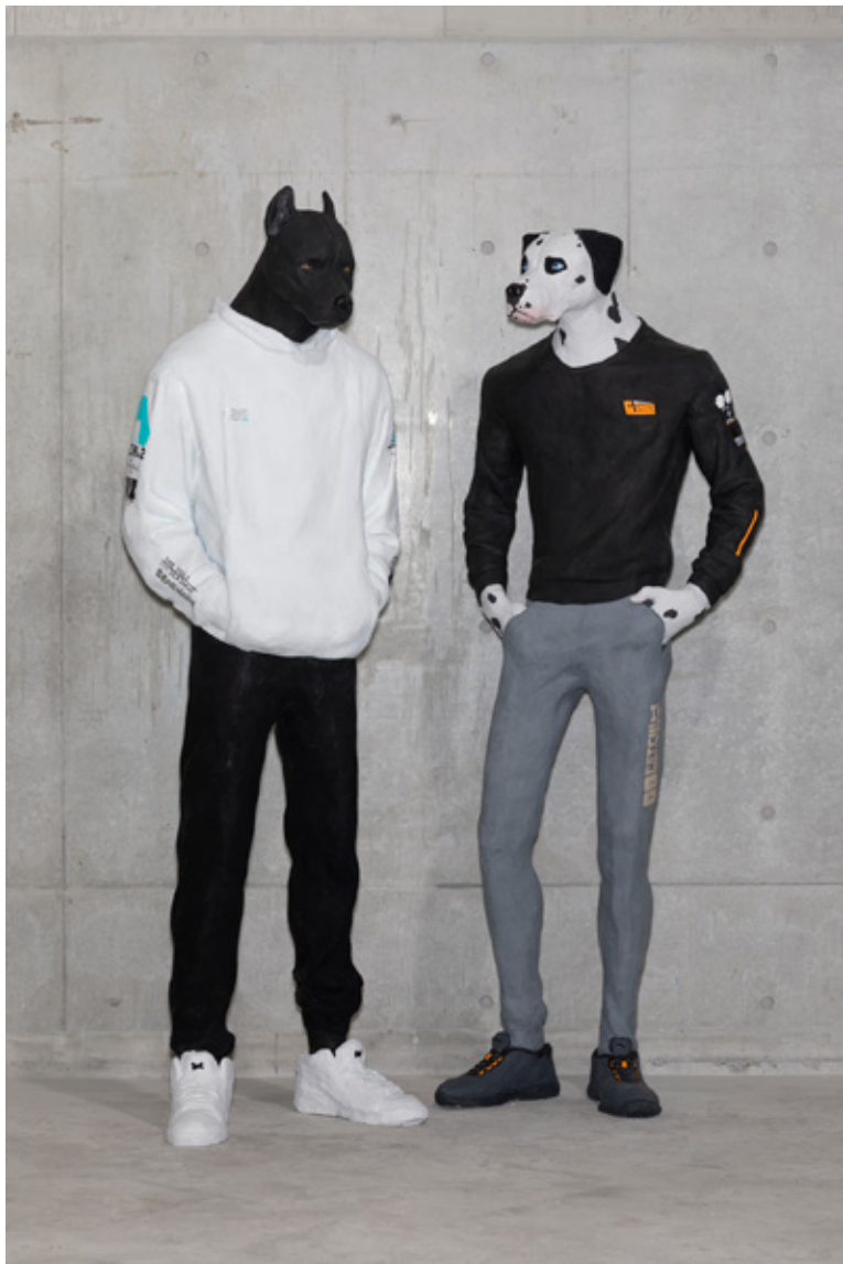
鈴木ふみ乃 「DOGGOS」 水性樹脂 / H1800×W700×D2000mm (2点1組)