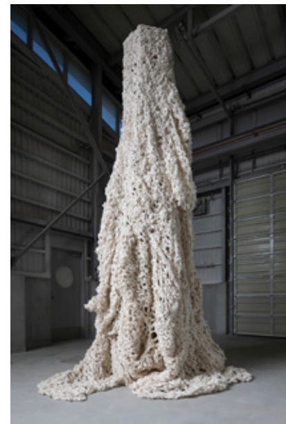
藤澤榮里 「188時間15分16秒」 手漉き和紙 / H4002×W250×D250mm