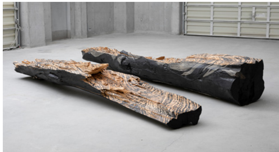
千田瑠璃 「たやすい」 銀杏、塗料 / H510×W3600×D1100mm