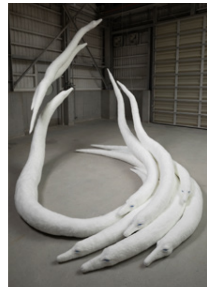
小野寺彩 「緞帯」 ポリエステル、羊毛 / H3000×W3500×D4000mm