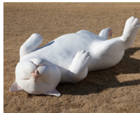
阿部みゆき 「NYANKO」 水性樹脂 / H840×W1500×D2500mm