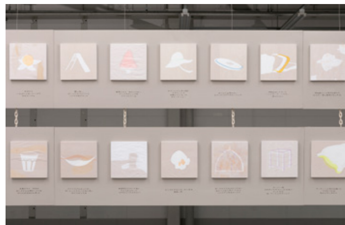
峯村里歩 「[FILTER]」 ミクストメディア / H1300×W5350×D40mm (2点1組)