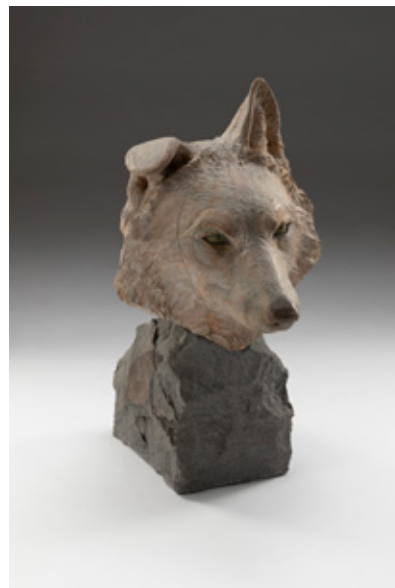
平良光子 「自刻像-極北-」 樟、小松石 / H730×W330×D530mm