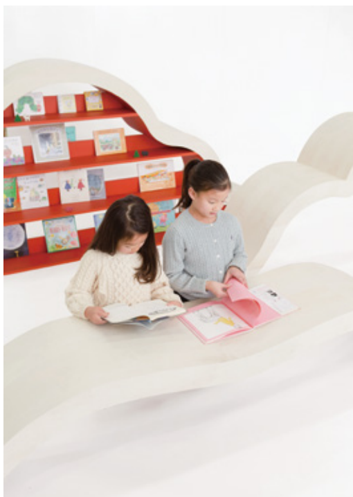
荒牧 郁 「yomuko」 木材 / 小 H450×W2300×D450mm、 中 H900×W2300×D450mm、 大 H1200×W2300×D450mm