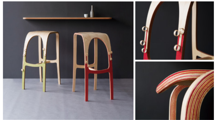
山崎ゆり子 「彩好 - irogonomi -」

ガラス、ランバーコア、クリスタルレジン、 LEDライト、マジックミラーシート / H450×W1200×D1200mm