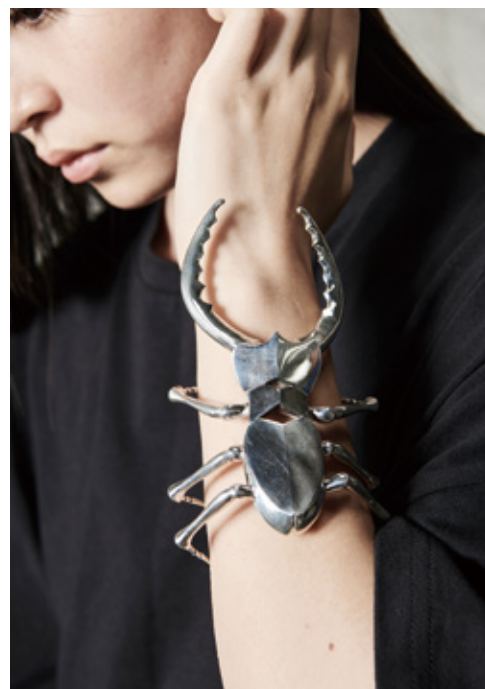
伊藤菜々子 「昆虫彩集」 金属、陽極酸化、他 / クワガタ H60×W50×D120mm、 チョウ H30×W80×D60mm、 ハチ H40×W20×D20mm、 アリ 全長1300mm、 ムカデ H15×W100×D100mm