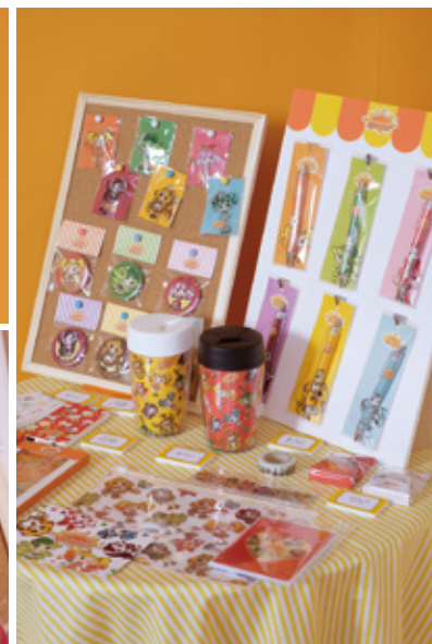
鈴木 綾 「Charming Juicie's」

紙、木、スチレンボード等、Adobe Photoshop、Adobe Illustrator、Unity / H2400×W2180×D3090mm (13点)