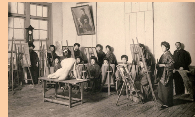
私立女子美術学校西洋画科教室 1915年頃

You can learn about the more than 120-year history of the "art university for women" through archives and other resources.